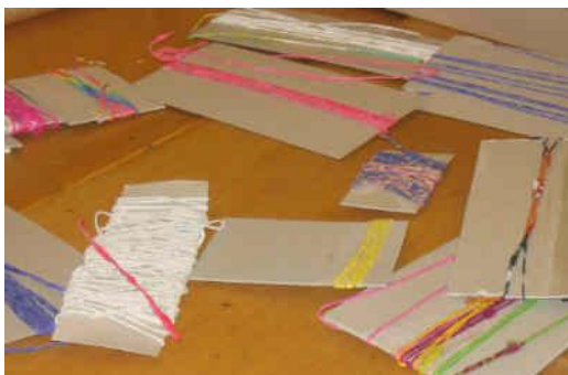
Fils en papier main, nature et teintés