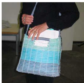
Sac en papier- espionnage