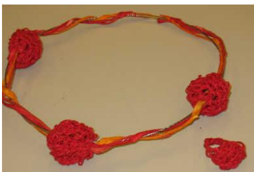
Collier et bague