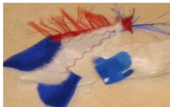
Shifu – de la feuille au fil